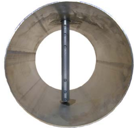
das Profil der deltaflow kann durch die Vielpunktmessung auch gestörte Strömungsprofile exakt erfassen

Für Sie bedeutet das, dass Sie ein langzeitgenaues und absolut robustes Messverfahren einsetzen, das Ihren Wartungsaufwand minimal hält und Ihnen die Qualität Ihrer Regelung auch noch nach Jahren sicherstellt.